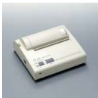
●オプションプリンタ VZ-330