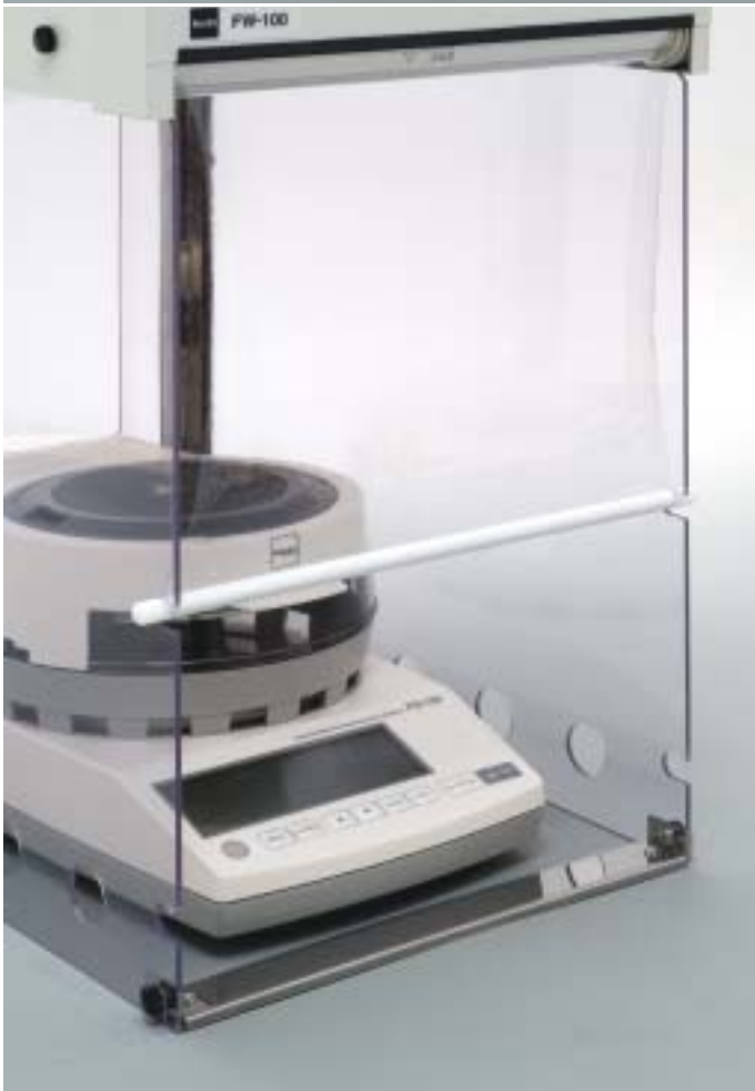
FW-100に赤外線水分計FD-720をセットした例