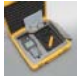
キャリングケース内部