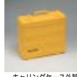
キャリングケース外観