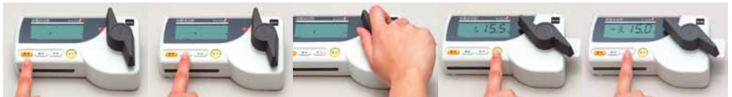
■電源ボタンを押し、「測定待ち」表示にします。■選択ボタンを押し、測定する試料を選びます。■測定部に試料を入れ、一気に粉砕します。■測定ボタンを押すと、水分値を表示します。■平均ボタンで測定回数と平均値を表示します。