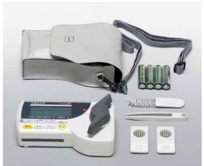
●ライスタ f5は持ち運びに便利なソフトケース付きです。