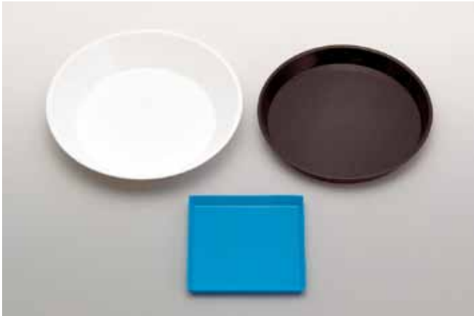
●多様な用途に対応する3種の形状と3色のバリエーション。(小角は青のみ)