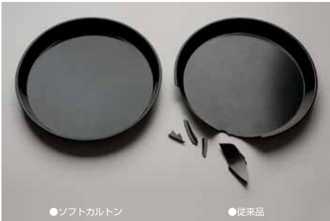
●ソフトカートンは高所から落下しても、従来品(右)のように欠けません。