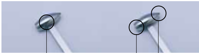
●側面 ●平面形状 ●円錐形状